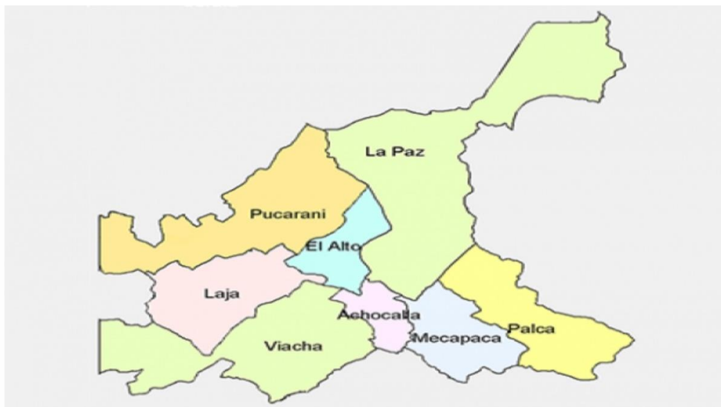
Imagen de archivo.