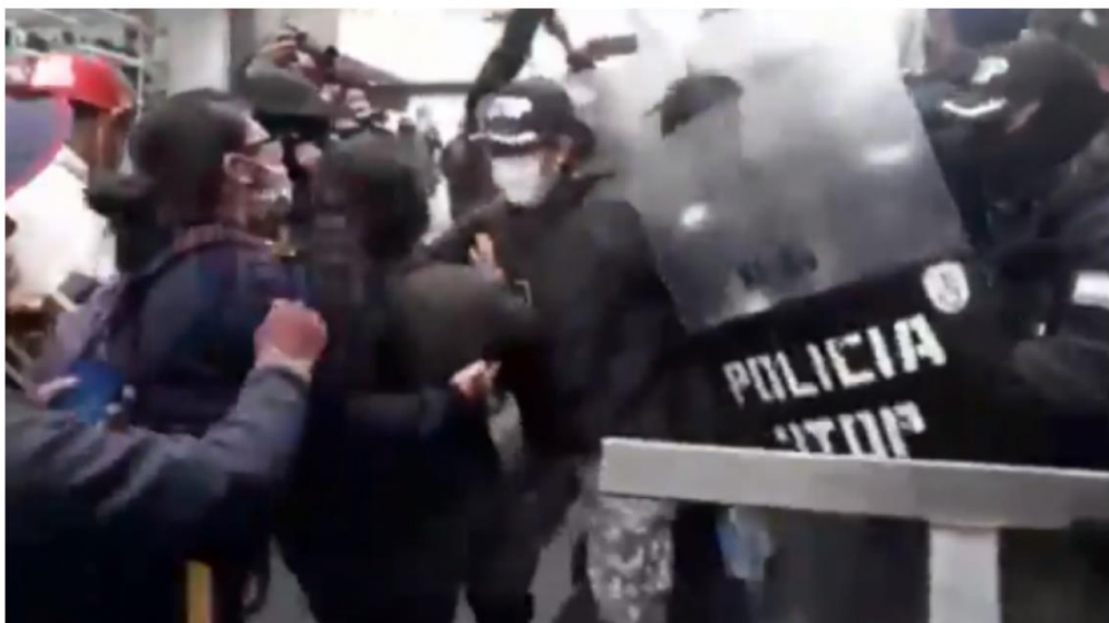
Policía reprimen la marcha de las personas con discapacidad.

Un grupo de personas no videntes protagonizaron una marcha exigiendo al Gobierno el pago de un bono, y fueron gasificados y golpeados por la policía.