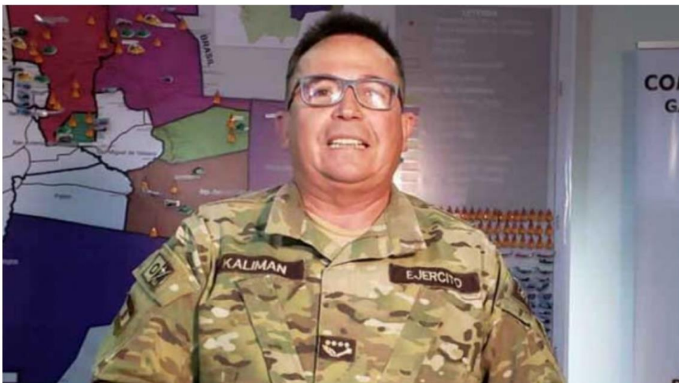
Excomandante de las FFAA, Williams Kaliman.