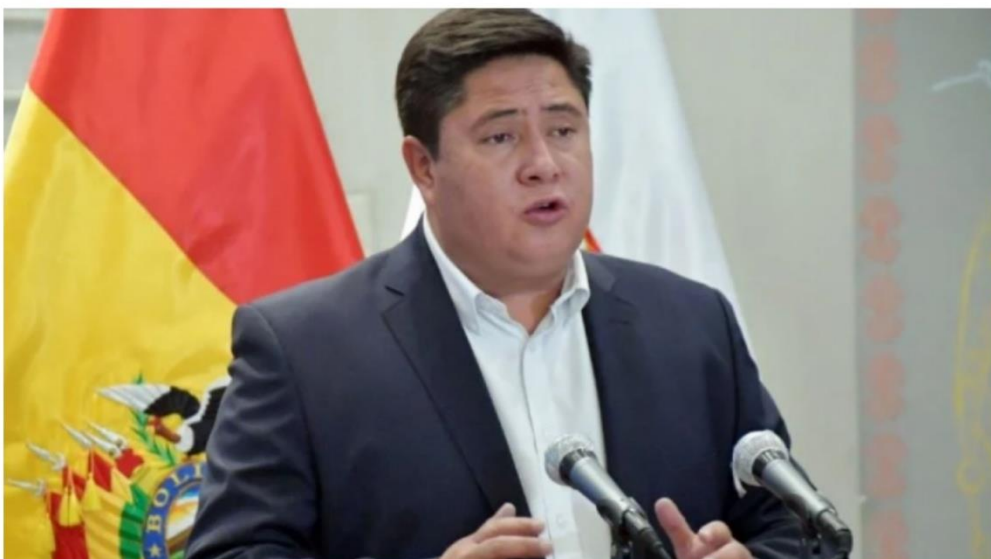
Exministro de Trabajo, Oscar Mercado.

Sobre las discrepancias en el gabinete ministerial, Mercado dijo que hubo varias actitudes que hicieron que tome la decisión de alejarse porque no se sentía cómodo.