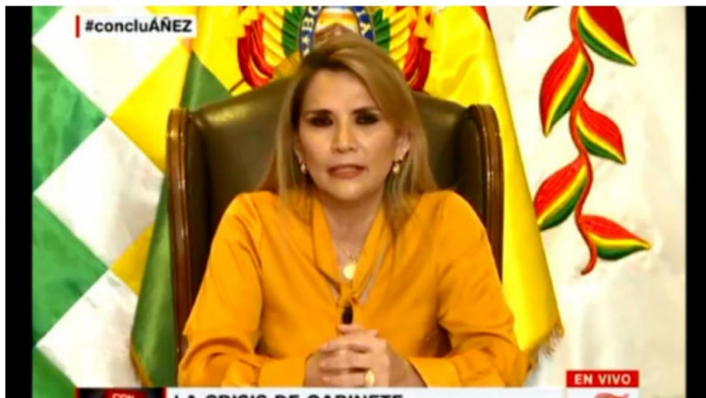
Jeanine Áñez, presidenta transitoria de Bolivia.

Áñez señaló que se encuentran tranquilos porque cuentan con todos los argumentos necesarios para poder defenderse en un proceso justo, en caso de tener que hacerlo.