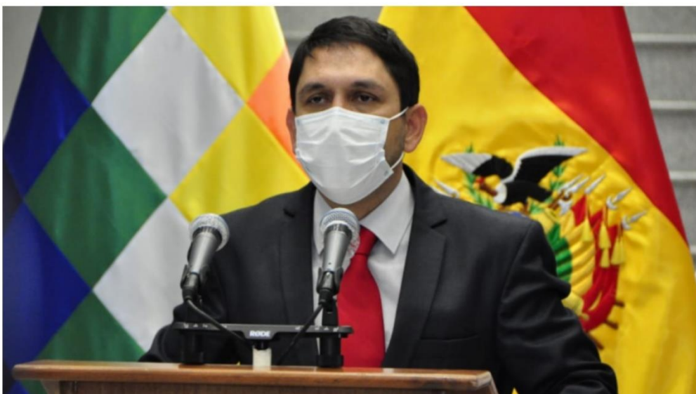
El viceministro de Transparencia, Guido Melgar.

“En el actuar de esta jueza se ha podido establecer de manera clara e inequívoca la parcialización y el afán de beneficiar a la señora Choque con las medidas sustitutivas”, señaló el viceministro Melgar.