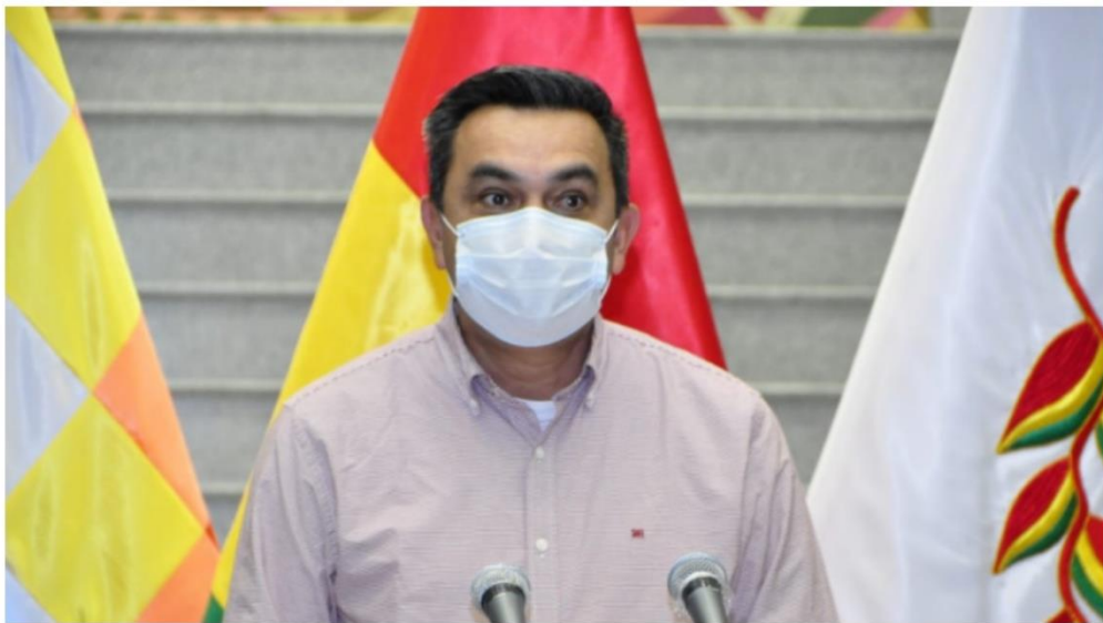
El ministro Yerko Núñez.

Los gobiernos subnacionales declararán auto de buen gobierno para la jornada electoral del próximo 18 de octubre.