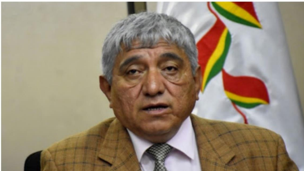
Ministro de Obras Públicas, Iván Arias.