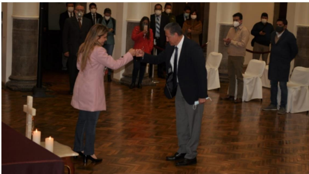
Posesión Ministro de Desarrollo Productivo y Economía Plural, Adhemar Guzmán Ballivián.

Por su parte, el flamante Ministro de Desarrollo Productivo y Economía Plural, Adhemar Guzmán Ballivián, manifestó su compromiso para consolidar un ambiente de libertad económica para la recuperación y el desarrollo de Bolivia.